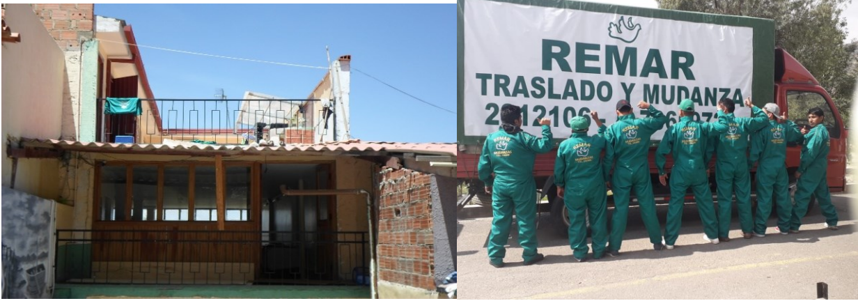
CASA-HOGAR DORCAS MALLASA